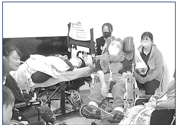
「感謝会」参加者の皆さん(その3)