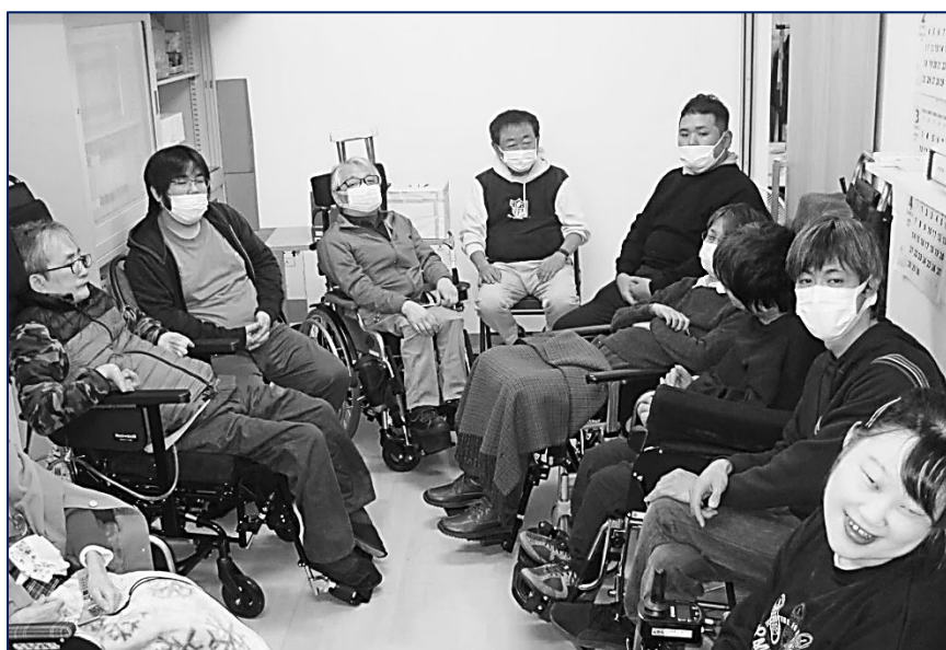
「感謝会」参加者の皆さん(その1)