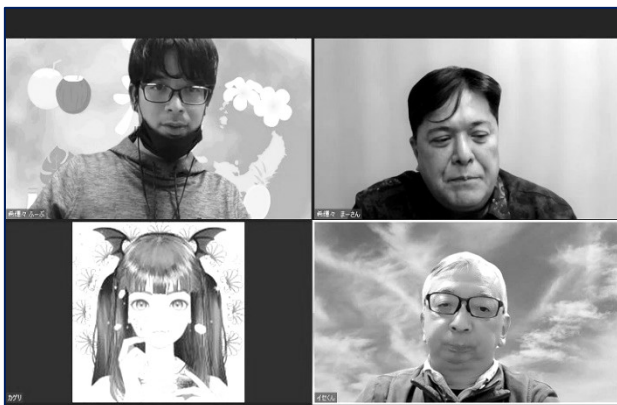
「Zoomでセッション会」の様子(Zoomのスクショ)