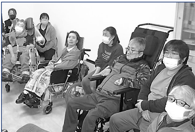
「感謝会」参加者の皆さん(その2)