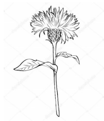
↑ 白いアザミ(花言葉は「自立心」)